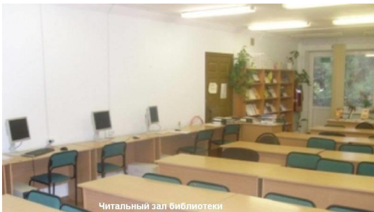
Читальный зал библиотеки