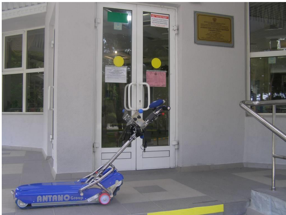
Гусеничный подъемник для инвалидов LG 2004 для беспрепятственного передвижения по лестнице